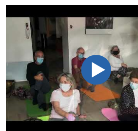
SANTÉ, PÔLE SENIORS Atelier bien-être seniors : Qi Gong - 4/13