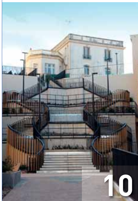
Votre nouveau centre ville en images