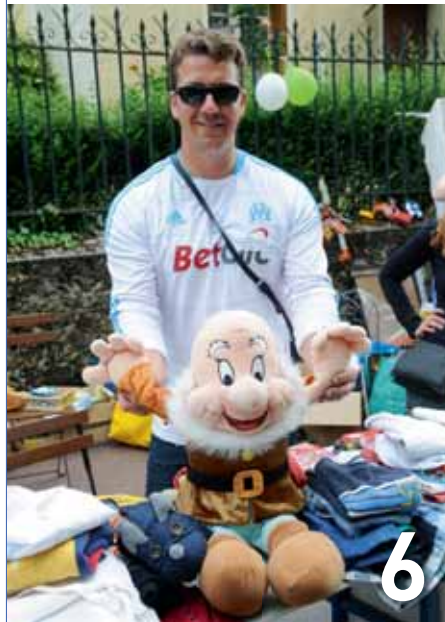
Votre été à Chaville

Ces éventuels changements seront annoncés sur la page facebook.com/chaville .