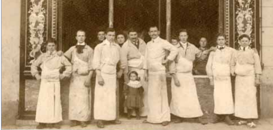
Le personnel de la boucherie Beauvais avant la guerre.