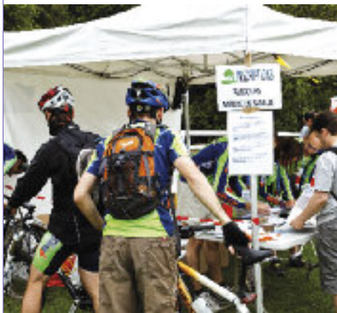
L'équipe de Raid-Up est très impliquée dans l'organisation du Parcours Sport Nature en famille, proposé lors du Festival des Sports de Nature.

Association d'activités de pleine nature créée en 2001, Raid Up propose des sports très variés comme le VTT, la course d'orientation, la course à pied, le canoë/kayak, le Trail... Les membres de Raid Up sont aussi très impliqués dans l'organisation du Festival des Sports de Nature, qui a lieu fin juin au stade Marcel Bec de Meudon.