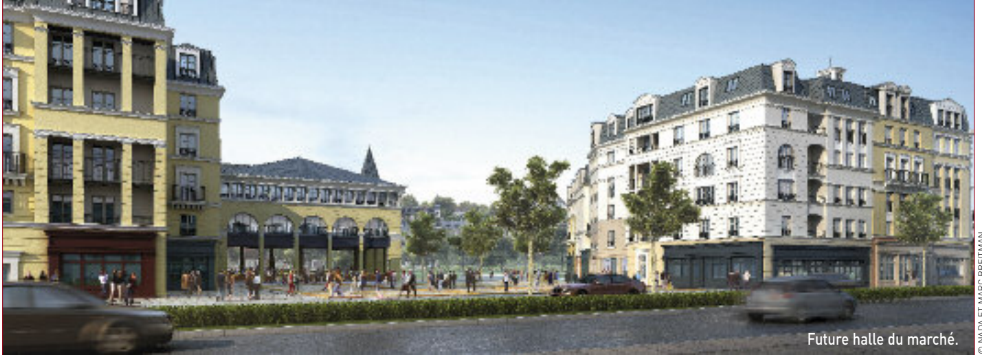
Future halle du marché.