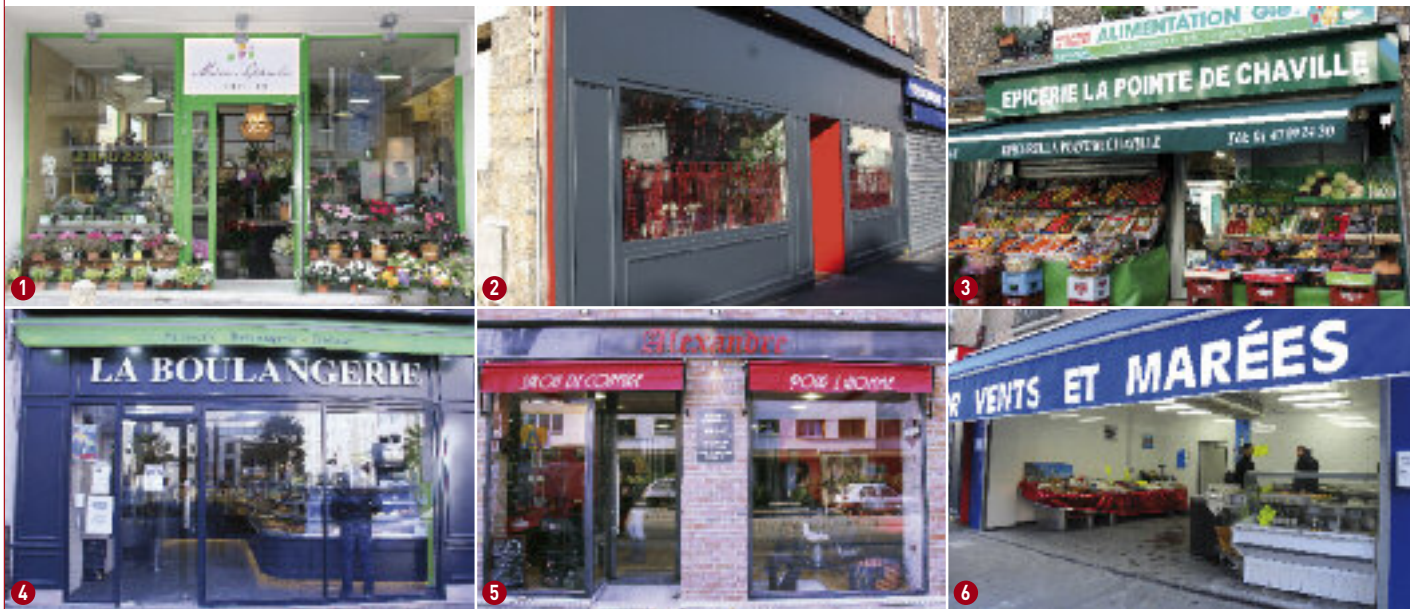
1 Fleuriste "Mai en septembre" - 667, avenue Roger Salengro 2 Restaurant chinois "Kim Yang" - 536, avenue Roger Salengro 3 Épicerie "À la Pointe de Chaville" - 2213, avenue Roger Salengro 4 "La Boulangerie" - 910, avenue Roger Salengro 5 "Alexandre pour l'homme" - 428, avenue Roger Salengro 6 Poissonnerie "Vents et marées" - 530, avenue Roger Salengro