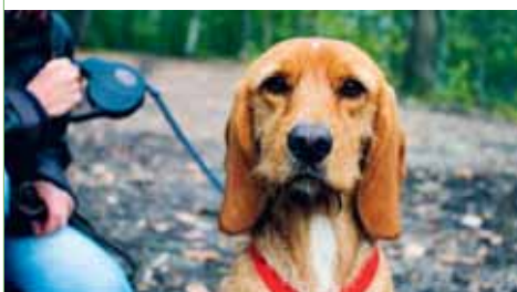
Rens. au 06 27 25 03 29 et sur le site www.preventioncanine.com