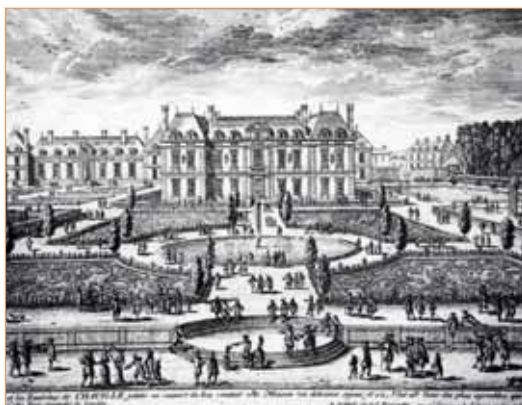
Gravure de Pérelle, fin XVII e .

Après avoir recoupé l’ensemble des archives, ils ont réalisé une maquette 3D du domaine : le château, les communs, la ménagerie, le village et les jardins.