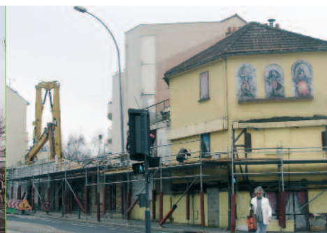
Les travaux en date du 23 mars.