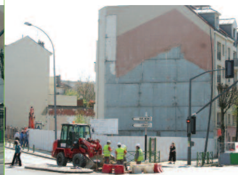
La fin du chantier de démolition.