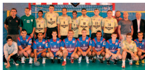
L'équipe première a pratiquement assuré son maintien en N3 cette saison.