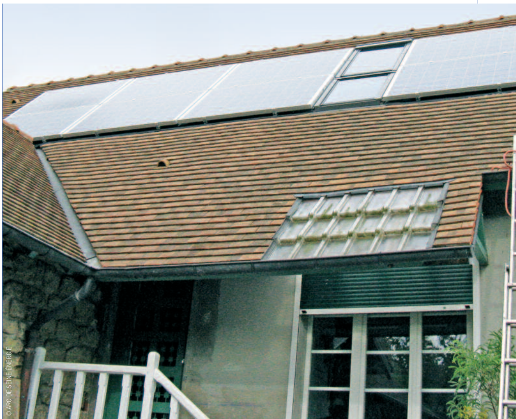
Les panneaux solaires photovoltaïques sont intégrés à la toiture.

La visite se déroulera en présence du propriétaire, de l'installateur et du conseiller info énergie d'Arc de Seine Énergie. Vous pourrez découvrir les motivations qui ont poussé cet habitant à réaliser son projet, les démarches qu'il a dû effectuer et ses conseils à ce sujet, les détails techniques de l'installation, ainsi que les aides financières disponibles. ■