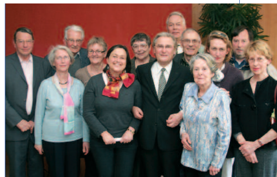
Le bureau du Club municipal des anciens de Chaville.

jardinage intergénérationnel, cuisine, initiation à Internet, randonnées adaptées aux seniors, couture, pétanque, aquagym, sorties et voyages... Des ateliers sont également organisés en lien avec la Villa Beausoleil (Wii, loto, ciné club, etc.). En outre, des professionnels sont à l'écoute des adhérents du Club pour les aider à bien préparer leur retraite. À noter : l'ensemble de ces activités sont présentées dans un livret édité chaque semestre et disponible auprès du Club. Pour les adhérents qui souhaitent s'impliquer activement dans la vie du Club, sachez que le bureau recherche des bénévoles, notamment afin de mettre en place un système de covoiturage. "Être utile et se faire plaisir", telles sont les devises du Club municipal des