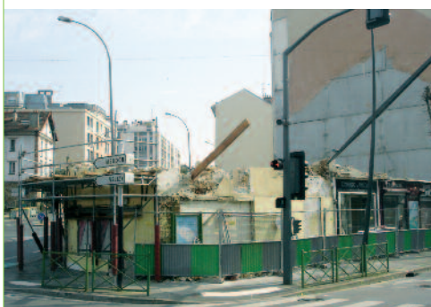
L'avancement des travaux au 1 er avril.