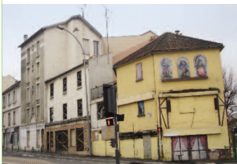
Le Puits-sans-vin avant démolition.