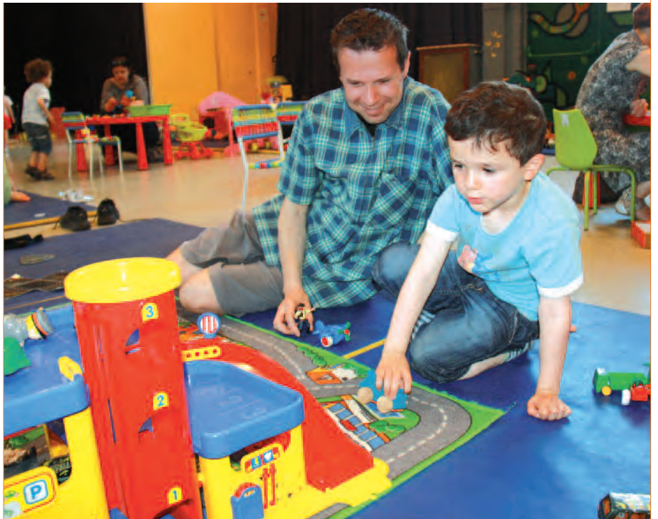
Un moment de complicité entre parents et enfants lors de la Fête du Jeu organisée par la ludothèque le 26 mai.

Pendant les vacances d'été, la ludothèque propose aux enfants de devenir de petits explorateurs. À la manière des archéologues, ils partiront sur les traces du passé. L'occasion de découvrir de manière ludique les dinosaures, la préhistoire, etc. Plus d'infos auprès de la MJC de la Vallée.