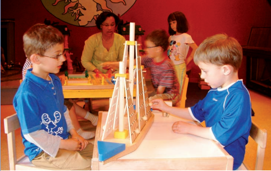
La ludothèque de la MJC de la Vallée ouvre ses portes du 3 au 11 juillet aux enfants de 3 à 10 ans.