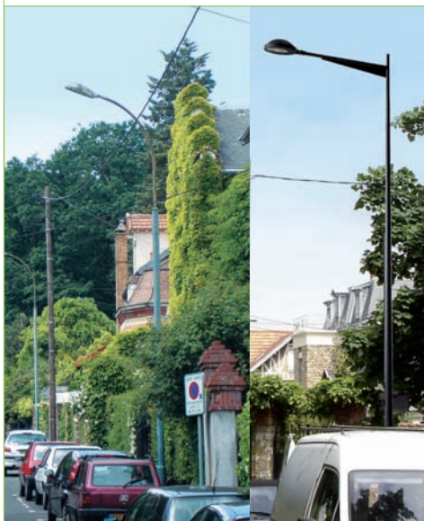
L'éclairage public actuel de la rue Delapierre (à gauche) et après travaux (à droite).

Au cours des mois de juillet et août, d'autres lieux seront le théâtre de travaux. Les équipes travailleront notamment dans l'école maternelle les Iris, dont le faux-plafond situé dans le hall sera remplacé. Des lavabos seront créés dans les classes des Jacinthes pour le confort des petits. Au groupe scolaire Anatole France, les derniers coups de pinceaux seront donnés dans les cages d'escaliers.