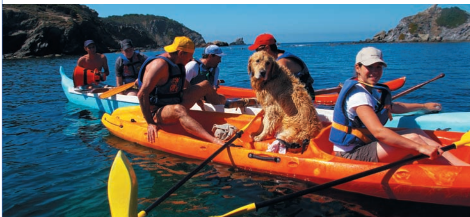
Le séjour handicap aura lieu cette année à la Palud sur Verdon.

Qu'ils partent à la conquête de l'ouest, à Bar-sur-Seine, la Palud sur Verdon, Sillé le Guillaume ou qu'ils passent l'été sur la commune, les enfants et les jeunes chavillois seront bien occupés, entre sorties et activités sportives et ludiques. Petit tour d'horizon de leur agenda estival.