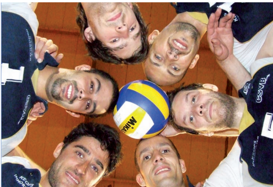
Le CSVB a coiffé l'équipe de Strasbourg sur le poteau.