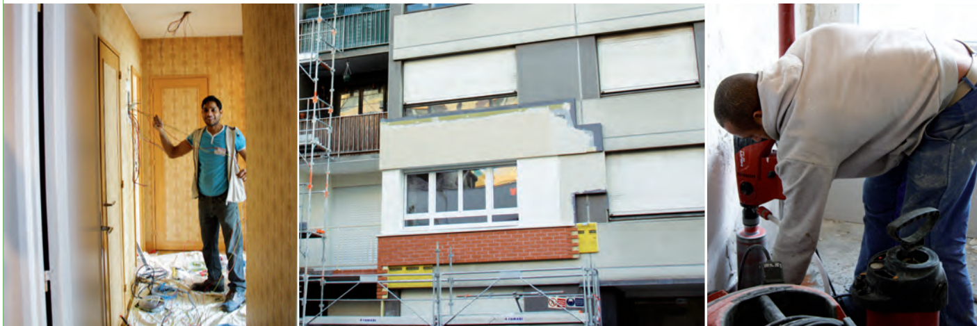
Électricité refaite en une journée.