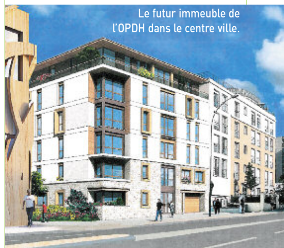
Le futur immeuble de l'OPDH dans le centre ville.

avons actuellement quatre opérations de ce type en cours sur Chaville. La prise en compte de la problématique de la précarité énergétique doit désormais être totalement intégrée à toute politique en faveur du logement pour tous. Enfin pour élargir toujours davantage l'éventail de l'offre locative sociale sur Chaville, nous travaillons actuellement sur deux projets importants : une résidence-service sociale pour les personnes âgées et un projet de maison-relais pour l'accueil et l'insertion des populations les plus fragiles. ■