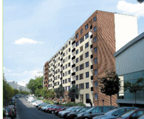
Réhabilitation de la résidence Fontaine Henri IV

Opievoy, premier bailleur social de la ville, a lancé en octobre dernier un grand programme de rénovation de cet ensemble immobilier comprenant, d'une part, la destruction en décembre dernier du bâtiment D de la cité, afin de pouvoir faire place au futur square face à l'école maternelle, et d'autre part, la réhabilitation de trois immeubles représentant 80 logements. Les travaux de rénovation d'un premier bâtiment ont démarré en décembre dernier et se poursuivront début 2013 sur un deuxième bâtiment plus grand. Ils devraient se terminer dans le courant de l'année. Le ravalement du troisième et dernier bâtiment, qui abrite la loge de la gardienne, sera réalisé début 2014. Précisons que tous les habitants