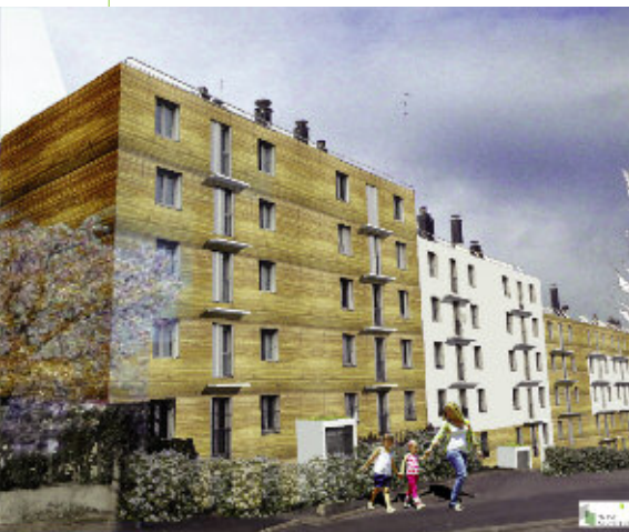
Réhabilitation de la cité Clémency

Afin d'inscrire la cité Clémency dans le nouveau paysage urbain du futur centre ville de Chaville et de contribuer à l'amélioration de l'habitat, le groupe