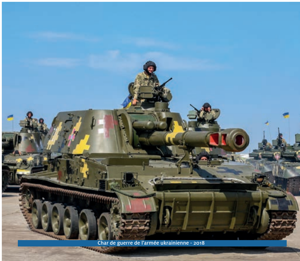
Char de guerre de l'armée ukrainienne - 2018

Historien, ancien diplomate, directeur de recherche au Collège des Bernardins à Paris et fondateur de l'Institut d'études œcuméniques de Lviv en Ukraine