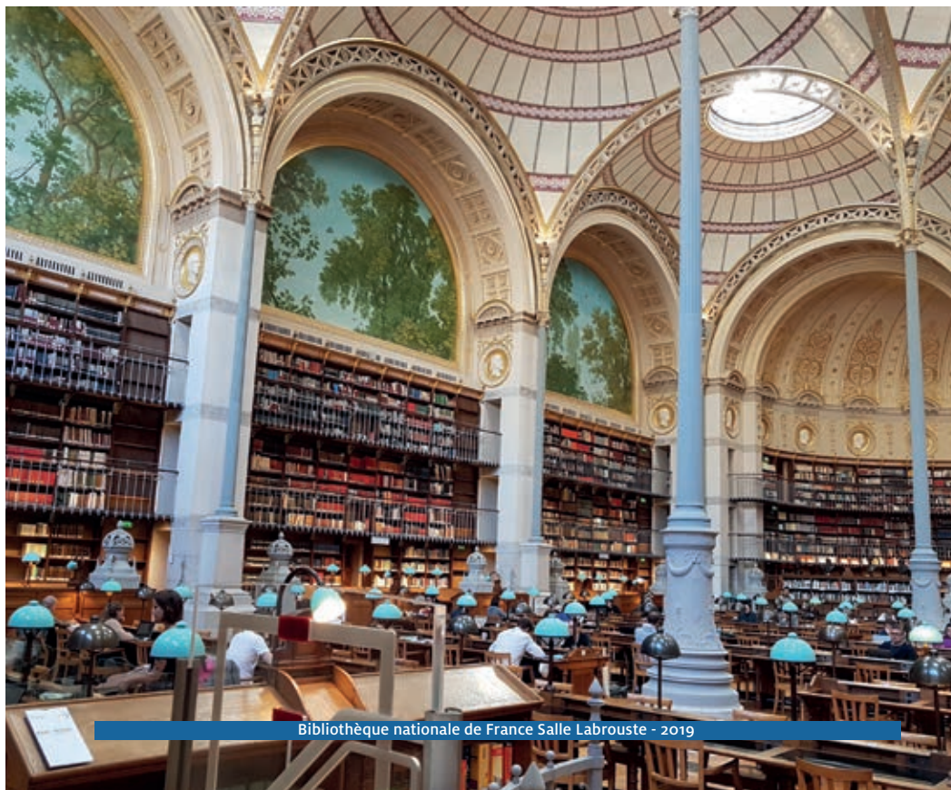
Bibliothèque nationale de France Salle Labrouste - 2019

Ensemble des 6 visites de monuments : 112,35 € 18,38€ la visite sous réserve de places disponibles