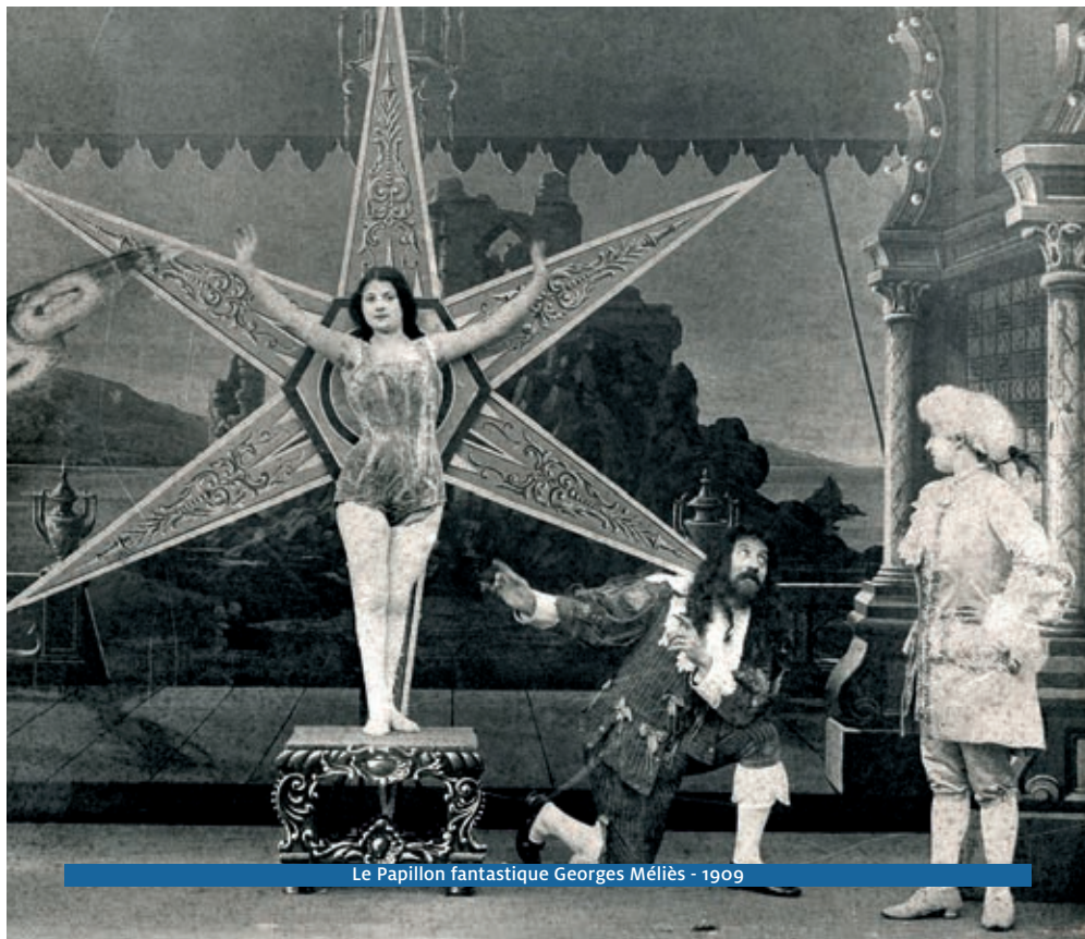
Le Papillon fantastique Georges Méliès - 1909