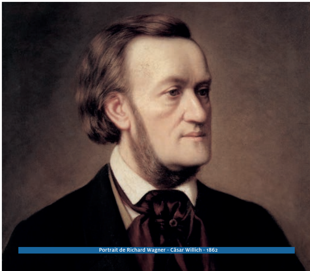
Portrait de Richard Wagner - Cäsar Willich - 1862