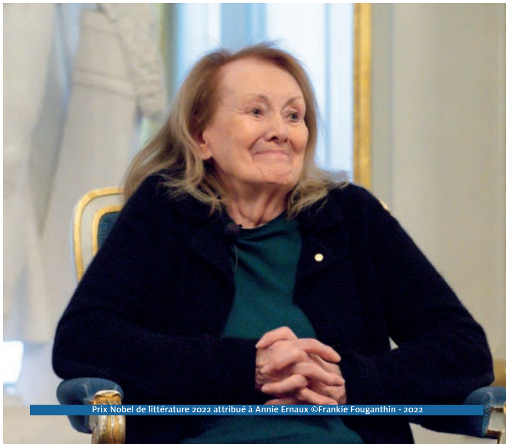
Prix Nobel de littérature 2022 attribué à Annie Ernaux

Professeur des universités, CY Cergy Paris université