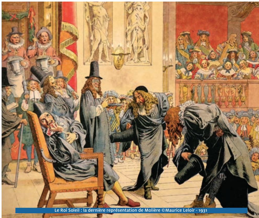
Le Roi Soleil : la dernière représentation de Molière ©Maurice Leloir - 1931

Professeur d'histoire culturelle et d'études théâtrales à l'Université Paris 8 et visiting professor à New York University, commissaire d'exposition, dramaturge et essayiste. Auteur de La Comédie-Française, une histoire culturelle