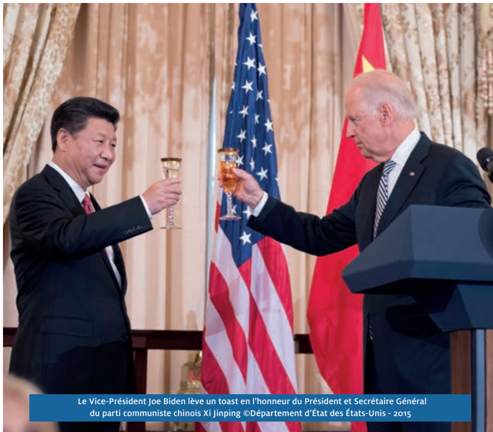
Le Vice-Président Joe Biden lève un toast en l'honneur du Président et Secrétaire Général du parti communiste chinois Xi Jinping

Docteur en géographie, spécialiste de la Chine, de l'Asie et de relations internationales