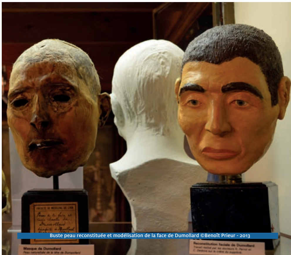
Buste peau reconstituée et modélisation de la face de Dumollard