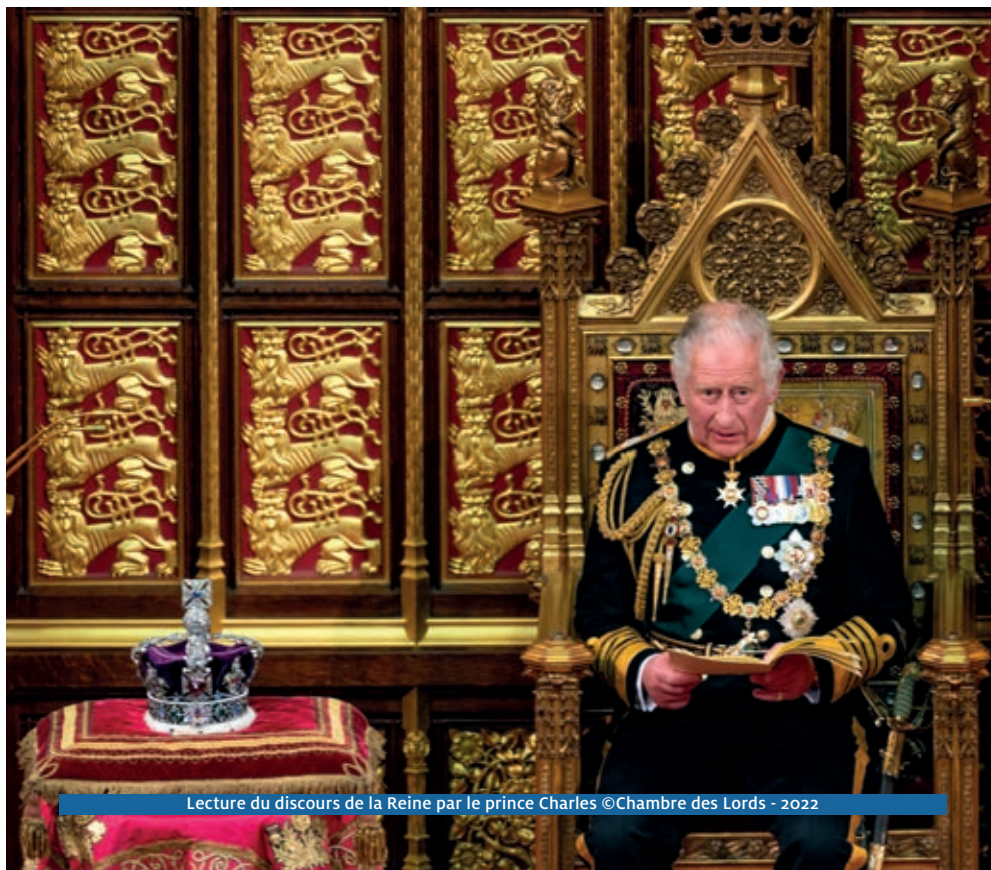
Lecture du discours de la Reine par le prince Charles

Spécialiste de la monarchie britannique, auteure de Elizabeth II : dans l'intimité du règne, de Charles et Camilla : une histoire anglaise, et de Naissance d'une reine