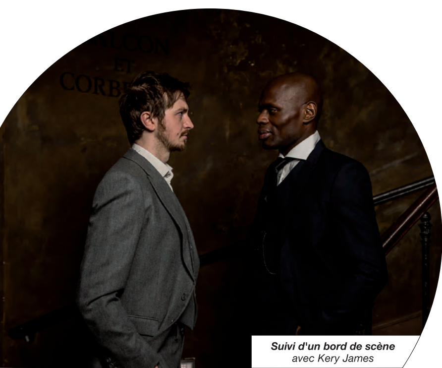
Suivi d'un bord de scène avec Kery James