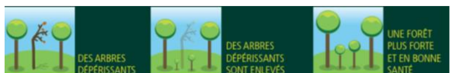
Illustration d'une coupe de sécurité

Ces arbres dépérissants représentent un danger sérieux pour les promeneurs, usagers des forêts et résidences aux alentours. Risques de chablis (déracinement) et de chutes de branche seront ainsi évité grâce à ces coupes de sécurités diminuant ainsi les dangers pour les promeneurs.