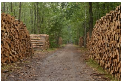
Le bois est entreposé en bordure de chemin avant d'être évacué

Les bois font l'objet d'un tri par l'ONF. Selon leurs qualités, ils seront utilisés pour de la trituration (fabrication de panneaux de particules), en bois de chauffage, bois d'industrie ou bois d'oeuvre (sciages, charpente,....) pour les produits de qualité.